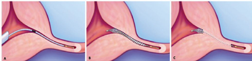
Slika 1: Histeroskopska sterilizacija s sistemom Essure: vstavitvi mikrosadka v jajcevod (a) sledi sprostitvev mikrosadka (b) ter rast vezivnega tkiva, ki obda mikrosadek in povzroči zaporo jajcevoda (c). 5