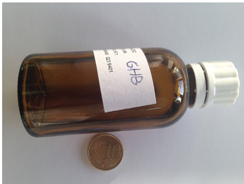
Slika 1: Steklenička z GHB, najdena pri bolniku, ki se je zaradi zastrupitve z GHB zdravil v UKC Ljubljana.

Namen naše raziskave je bil ugotoviti pogostost bolnišnične obravnave zastru-