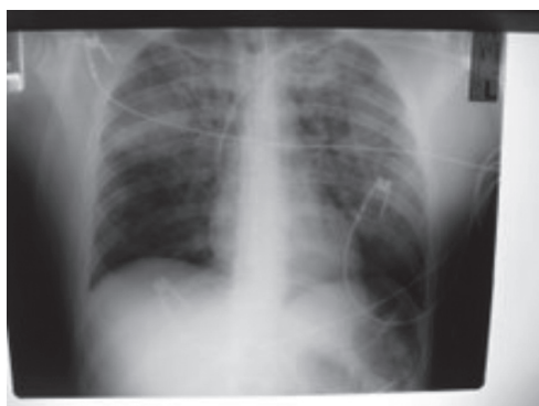
Sl. 3. Kontrolni RTG prsnega koša tri ure po sprejemu v enoto za intenzivno zdravljenje.

Bolnika so istega dne prevedli na podporne oblike predihavanja ter mu naslednji dan odstranili sapnično dihalno cevko in ga premestili na oddelek intenzivne