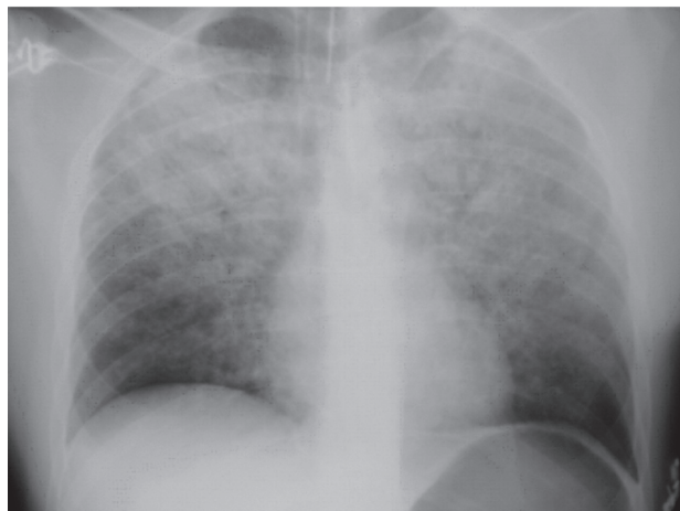
Sl. 2. Difuzni pljučni edem. Figure 2. Diffuse pulmonary edema.

Opravili smo fizikalni pregled bolnika. Bolnik je bil pri zavesti, v ustih je imel obilo penasto rožnatega izpljunka. Nad celotnimi pljuči je bilo slišati pokce v obeh fazah dihanja. Trebuh je bil napet. Opravili smo slikovno diagnostiko. RTG prsnega koša je pokazal difuzne intersticijske in alveolne infiltrate (Sl. 2).