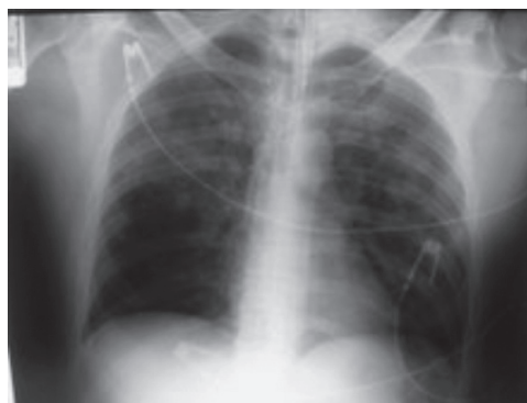
Sl. 4. RTG prsnega koša ob odpustu iz enote za intenzivno zdravljenje.

nege v dobri kondiciji. RTG prsnega koša ob odpustu je bil v mejah normalnega (Sl. 4).