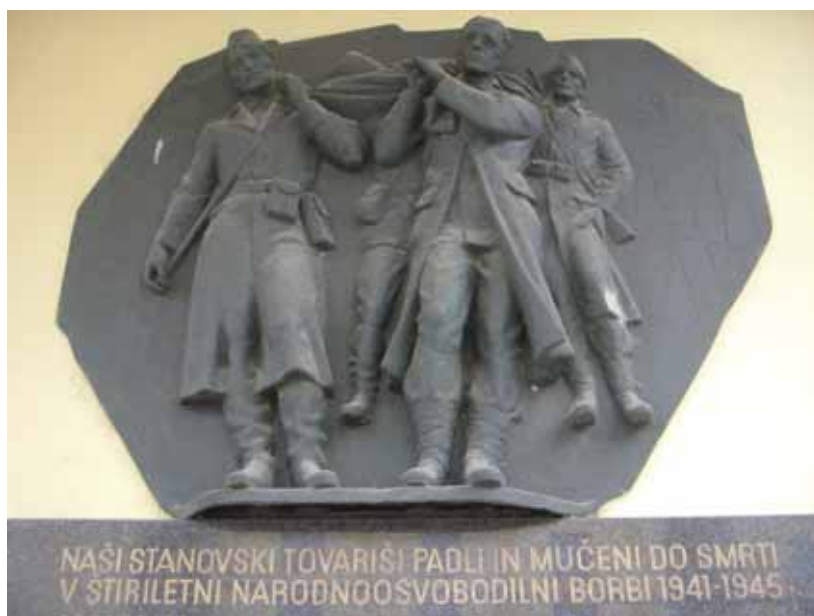
Slika 6: Vrhnji del spominske plošče med 2. svetovno vojno padlih zdravnikov in medicincev na pročelju nekdanjega Dergančevega sanatorija na Komenskega ulici 4 v Ljubljani, kjer je desetletja domovalo Slovensko zdravniško društvo. Na spodnjem delu plošče so poimensko navedeni vsi padli.