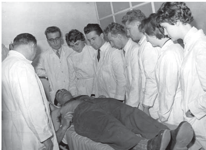
Slika 9: Študenti medicine pri kliničnih vajah v šestdesetih letih 20. stoletja.