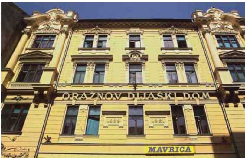
Slika 5: Oražnov dijaški dom na Wolfovi ulici v Ljubljani

logijo, za kirurško in interno kliniko pa so tik pred vojno zgradili prizidek k stavbi kirurškega oddelka. Obe kliniki so odprli poleti 1941. V vojnih letih je fakulteta životarila. Predavanja so se nadaljevala, prav tako vaje, vse več profesorjev, asistentov in študentov pa se je vključevalo v osvobodilno gibanje, ali so odšli v partizane ali so bili zaprti, pregnani v taborišča ali odpeljani na prisilno delo. Pouk je prenehal junija 1943. 15 Med vojno je slovensko zdravništvo zgubilo 31 zdravnikov in MF 44 študentov medicine. 16 (Slika 6)