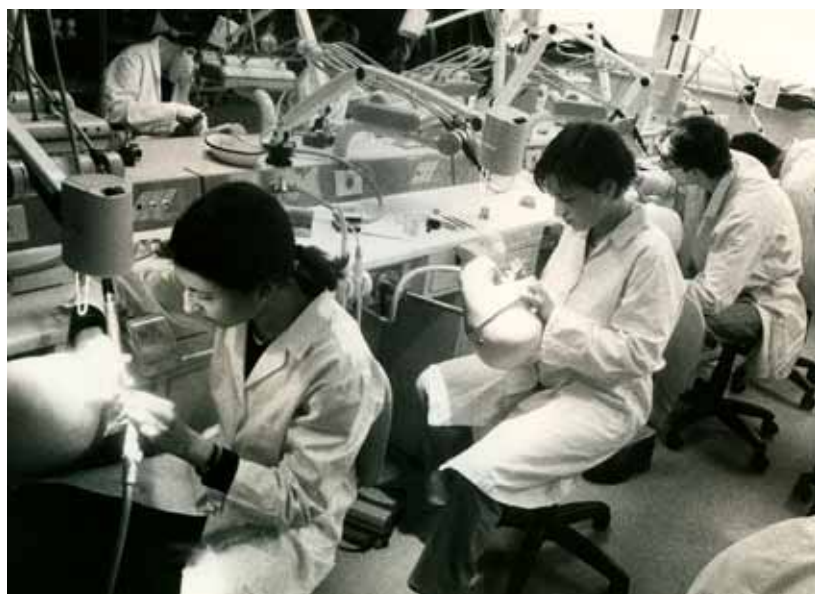
Slika 13: Študenti dentalne medicine pri vajah na fantomih (slika Jelka Simončič, 1999)

V letih 1920 do 1930 je bilo v oba letnika medicine vpisanih okoli 100 študentov, med letoma 1930 in 1940 okoli 200 študentov, po letu 1940 je njihovo število naraščalo in je bilo v vse tri letnike vpisano 300–400 študentov. Na popolni MF je bilo po letu 1949 vpisanih 600–1000 študentov. Vpis novincev je med letoma 1945 in 1962 stalno naraščal (400 in več novincev letno), nato pa so ga omejili na 150 mest za študij splošne medicine in 50 mest za študij stomatologije. 21 Kljub številnim vlogam MF na uradne naslove, da bi vpis povečali, saj so predvidevali pomanjkanje zdravnikov po upokojitvi številčne povojne generacije, so MF šele zadnje desetletje odobrili povečan vpis študentov. V akademskem letu 2007/08 je bilo na študijski program splošna medicina vpisanih 228 študentov in na študijski program dentalna medicina 71 študentov. V vseh šestih letnikih študija medicine in dentalne medicine na dodiplomski stopnji je bilo vpisanih 1.633 študentov (brez absolventov), na podiplomski stopnji pa 350 študentov. MF je povečan vpis zaradi pomanjkanja prostorskih in kadrovskih možnosti zelo obremenil in pouk spet poteka od zgodnjih jutranjih do kasnih večernih ur. Ljubljansko MF je delno razbremenilo odprtje MF v Mariboru leta 2004, ki