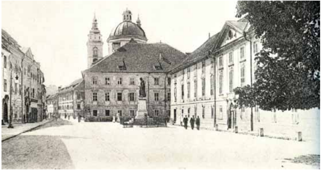
Slika 1: Licejska stavba na Vodnikovem trgu v Ljubljani, kjer je v času Ilirskih provinc (1809–1813) nastala predhodnica slovenske medicinske fakultete.