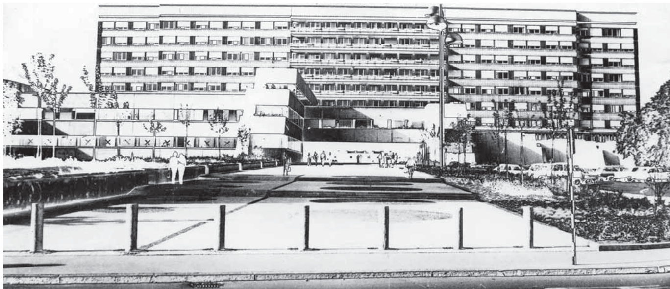
Slika 12: Stavba Univerzitetnega kliničnega centra, delo arhitekta akad. Stanka Kristla, uradno predana namenu leta 1975

ovrednotila. Uvedli so individualne raziskovalne predmete in javne predstavitve predlogov magistrskih nalog, ki še danes sestavljajo bistveni del doktorskih programov.