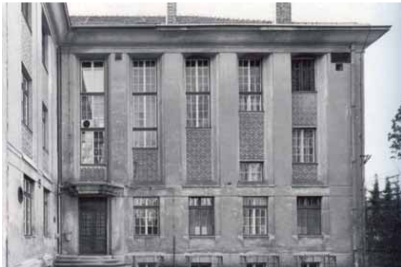
Slika 3: Pogled na eno prvih novih univerzitetnih stavb sploh, stavbo Anatomskega inštituta na Zaloški cesti v Ljubljani, delo arhitekta prof. Ivana Vurnika (1884–1971) iz dvajsetih let 20. stoletja.