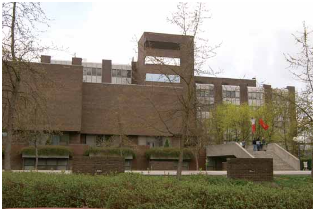
Slika 15: Stavba Medicinske fakultete v Ljubljani (foto Jelka Simončič, 2007)

Ljubljanska medicinska fakulteta je z 90-letno tradicijo od nepopolne, ustanovljene 1919, do popolne, ustanovljene leta 1945, dokazala svojo trdnost, pedagoško in strokovno uspešnost in prodornost. Za slovenski zdravstveni prostor je vzgojila nad 8.500 zdravnikov in zobozdravnikov, ki v domačem jeziku zdravijo bolnike, dajejo preventivno in kurativno zdravstveno varstvo vsej populaciji, nudijo strokovno pomoč v splošnih in specialističnih ambulantah, v regionalnih in kliničnih bolnišnicah, zdraviliških in rehabilitacijskih centrih, kjer na primarni, sekundarni ali terciarni ravni zagotavljajo vse potrebne zdravstvene usluge. Medicinska fakulteta v Ljubljani si je s podiplomskim študijem zago-