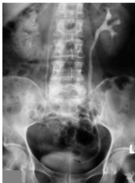
Sl. 1. Intravenski pielogram: kamen v spodnji tretjini sečevoda (puščica).

V gladkih mišicah spodnje tretjine sečevoda so najštevilčnejši \alpha_1 -adrenoreceptorji. 13 Njihovo stimuliranje zviša frekvenco peristaltičnih valov in tonus gladkih mišic, kar vodi v zmanjšanje pretoka seča. 14