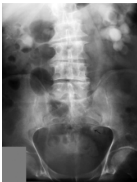
Sl. 3. Intravenski pielogram: kamen velikosti 12 mm (puščica) v spodnjem delu levega sečevoda (pielogram po neuspelem URS in ESWL).

Figure 2. URS: stone in the distal part of ureter.